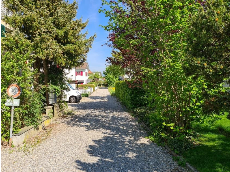
Blick von der Kappelenstrasse auf den Breitackerweg

Vom Kreisel kommend, biegst du rechts in den Breitackerweg ein. Es handelt sich um einen Privatweg, welcher auch als solcher gekennzeichnet ist. Das Zentrum für Meditation und Heilkünste Lyss befindet sich im letzten Haus der Strasse.