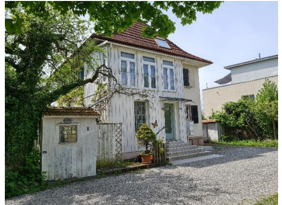
Das Zentrum für Meditation und Heilkünste Lyss

Sollte weiterer Bedarf für Parkplätze bestehen, kann der Parkplatz am Alten Viehmarktplatz (s. Kartenausschnitt) genutzt werden.